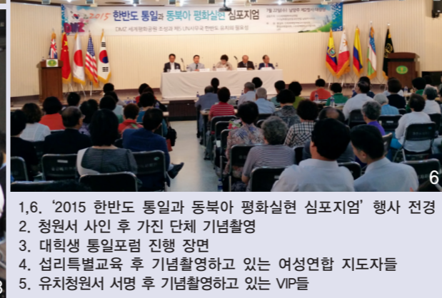
1,6. '2015 한반도 통일과 동북아 평화실현 심포지엄' 행사 전경 2. 청원서 사인 후 가진 단체 기념촬영 3. 대학생 통일포럼 진행 장면 4. 섭리특별교육 후 기념촬영하고 있는 여성연합 지도자들 5. 유치청원서 서명 후 기념촬영하고 있는 VIP들

한편, '한반도 통일과 동북아 평화실현을 위한 대학생 통일포럼'이 천력 5월 18일(양 7.3) '남북한 사회문화 통합 통일과정에서의 남북한 청년들의 역할'을 주제로 60여 명의 대학생들이 참석한 가운데 여성연합 주최로 세계일보 유니홀에서 개최됐다.