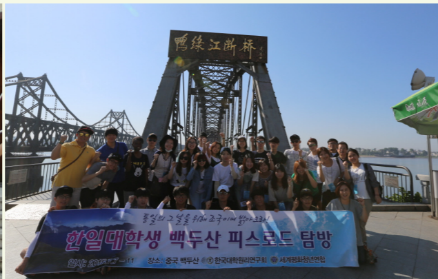
압록강 철교에서 기념촬영하고 있는 CARP 백두산 탐방단