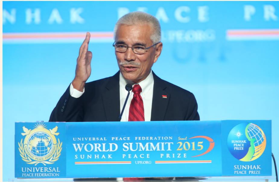
공동수상자 아노테 통 대통령

우리는 모두 기후 변화의 혹독함과 빈번함을 어느 정도 경험했습니다. 그렇지 않기를 바라지만 기후변화로 인한 재난이 지금보다 빈번해지면 전 세계에서 대참사가 발생하고, 싸움이 벌어지고 발전이 중단될 것입니다. 우리는 후손들을 위해 이 재난을 ‘인식’하는 것 이상의 일을 해야 합니다. 우리는 피해보는 사람 없이 평화와 안보문제를 포괄적으로 해결하는 ‘행동’을 해야 합니다. 우리 지구와 세계 공동체의 미래를 지키는 ‘행동’