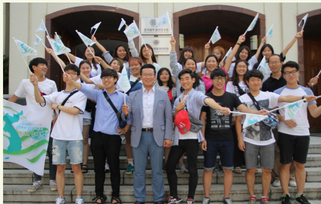
출발 전 CARP센터 앞에서 기념촬영하고 있는 CARP희망여행단