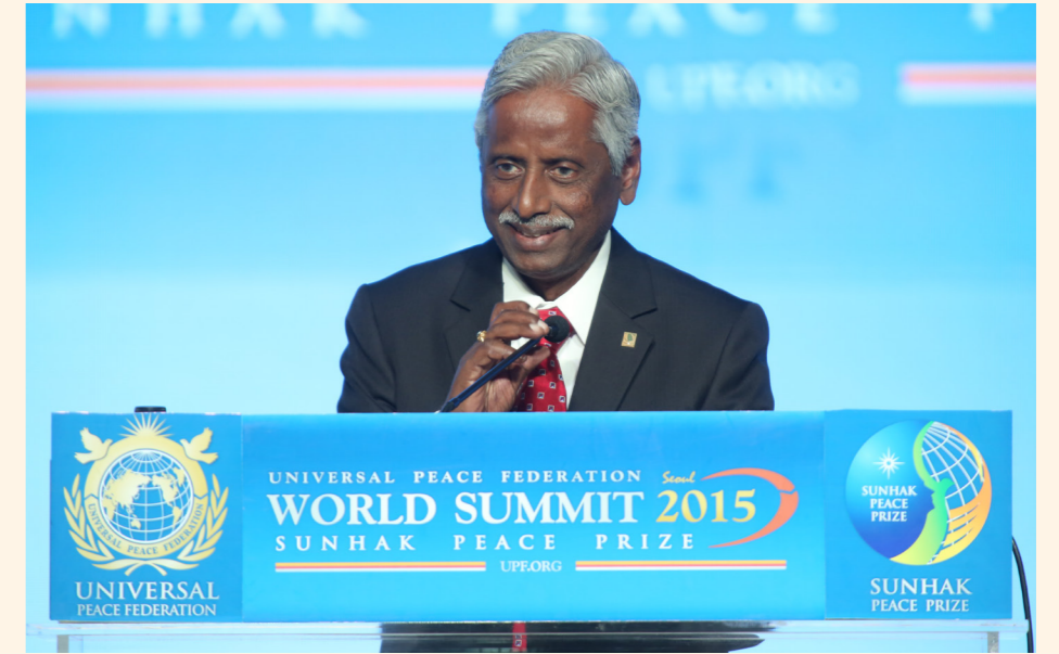
공동수상자 모다두구 굽타 박사

우리는 ‘소규모 농부들을 위한 기술 개발’로서 수산양식이야말로 토지 없는 수많은 사람들에게 혜택을 제공하는 수단과 방법이라고 생각했습니다. 유엔의 식량농업기구(FAO)와 국제 노동기구(ILO)에 따르면, 10억 이상의 세계 농업인구 가운데 거의 절반이 토지 없이 노동자로 일하고 있습니다. 또한 일을 하는 2억 4천만의 세계 어린이 중 60퍼센트가 수산업