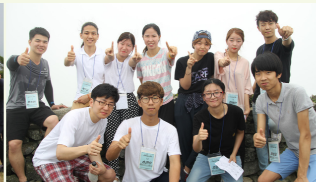
봉화산 성지에 오른 수련생

문선명 천지인참부모 천주성화 3주년을 맞아 한국대학원리연구회(이하 한국CARP)는 '2015년 하계 방중 특별수련(이하 특별수련)'을 비롯하여 CARP 희망여행단, 대학생 백두산 탐방, 제1회 우리노래 창작 경연대회 등의 기념행사를 개최하고 '2015 전국성화캠프'와 '청년학생세계총회'에 참석하는 등 참부모님의 전통상속과 더불어 통일가의 미래를 개척해 나가기 위한 다양한 활동을 전개했다.