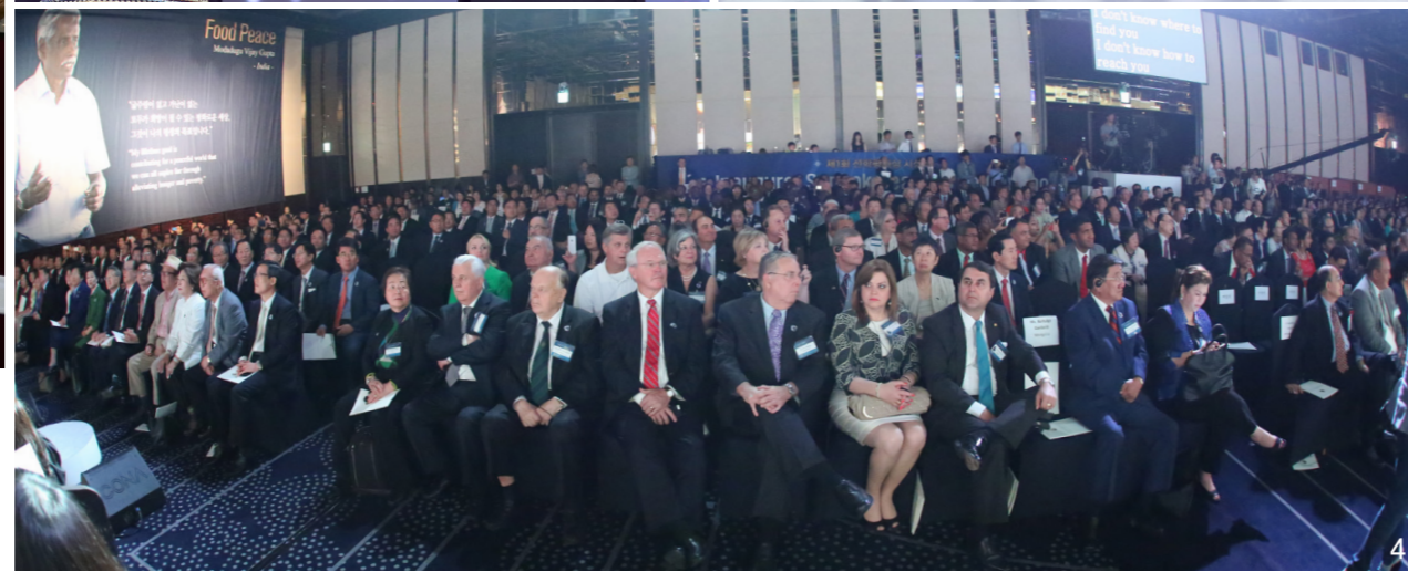
1. 제1회 선학평화상 시상식에 참석하신 참어머님 2. 선학평화상 공동수상자 아노테 통 키리바시공화국 대통령에게 시상하시는 참어머님 3. 선학평화상 공동수상자 및 홍일식 위원장과 기념촬영해주는 참어머님 4. 제1회 선학평화상 시상식에 참가한 국내외 귀빈들

‘제1회 선학평화상 시상식’이 천력 7월 15일(양 8.28) 오전 10시 서울 강남구 그랜드 인터컨티넨탈 서울 파르나스 호텔에서 개최됐다. 이날 시상식에는 선학평화상의 설립자인 참어머님을 모신 가운데 문선진 선학평화상재단 이사장, 정의화 국회의장, 서울평화상문화재단 이철승 이사장 등의 주요인사, 무하마드 유수프 칼라 인도네시아 부통령 등 ‘World Summit 2015’에 참석한 해외 전·현직 국가수반을 비롯하여 정관계, 학계, 재계, 언론계, 종교계를 대표하는 1,000여 명의 인사들이 참석하여 성황을 이루었다.