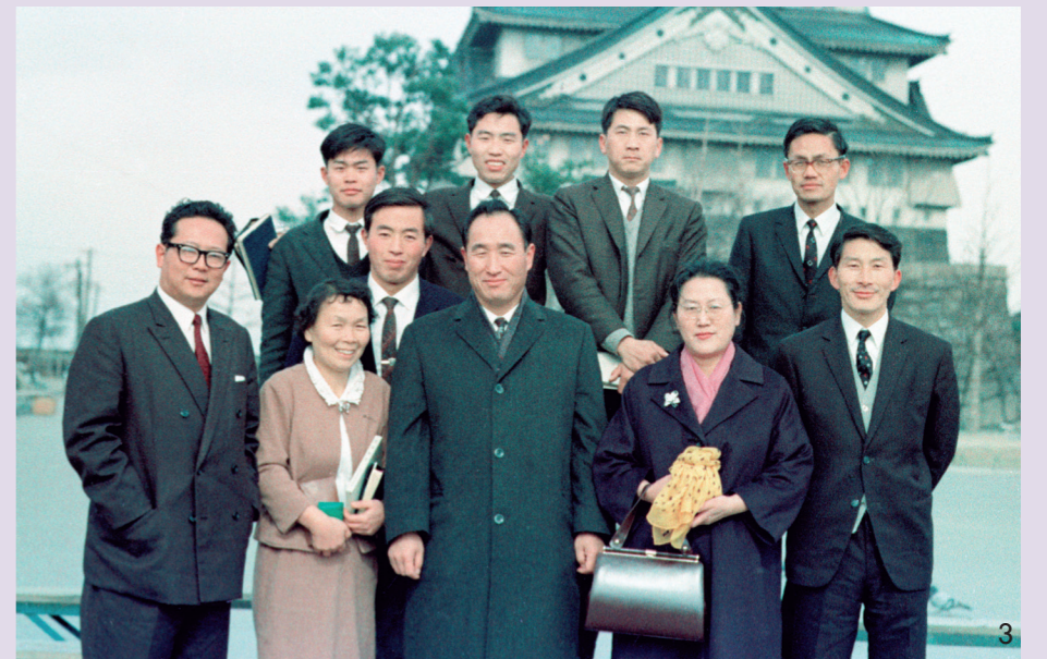
1. 1972년 2월 동경에서 열린 희망의 날 대향연 2. 사이타마에서 열린 식구집회에서 말씀하시는 참아버님 3. 1965년, 성지를 택정하신 뒤 가진 일본지도자들과 기념촬영해 주시는 참아버님