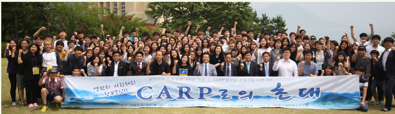
천주성화 3주년 승리를 결의하고 있는 한국CARP 제2차 하계 방중수련 참가자들