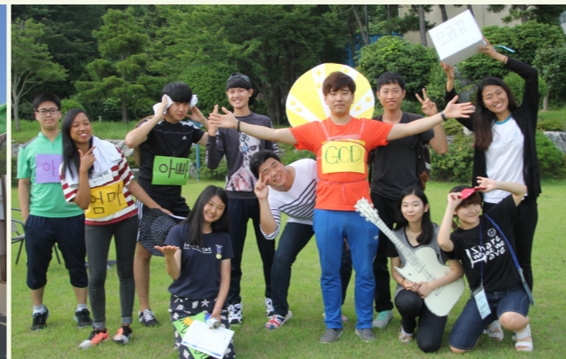
조별 프로젝트에 참여하고 있는 수련생