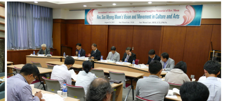
第7分科討論の全景