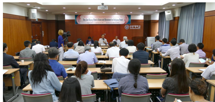
第2分科討論の全景