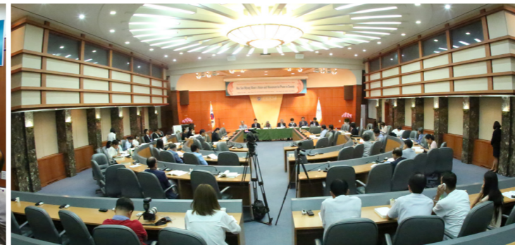
第5分科討論の全景