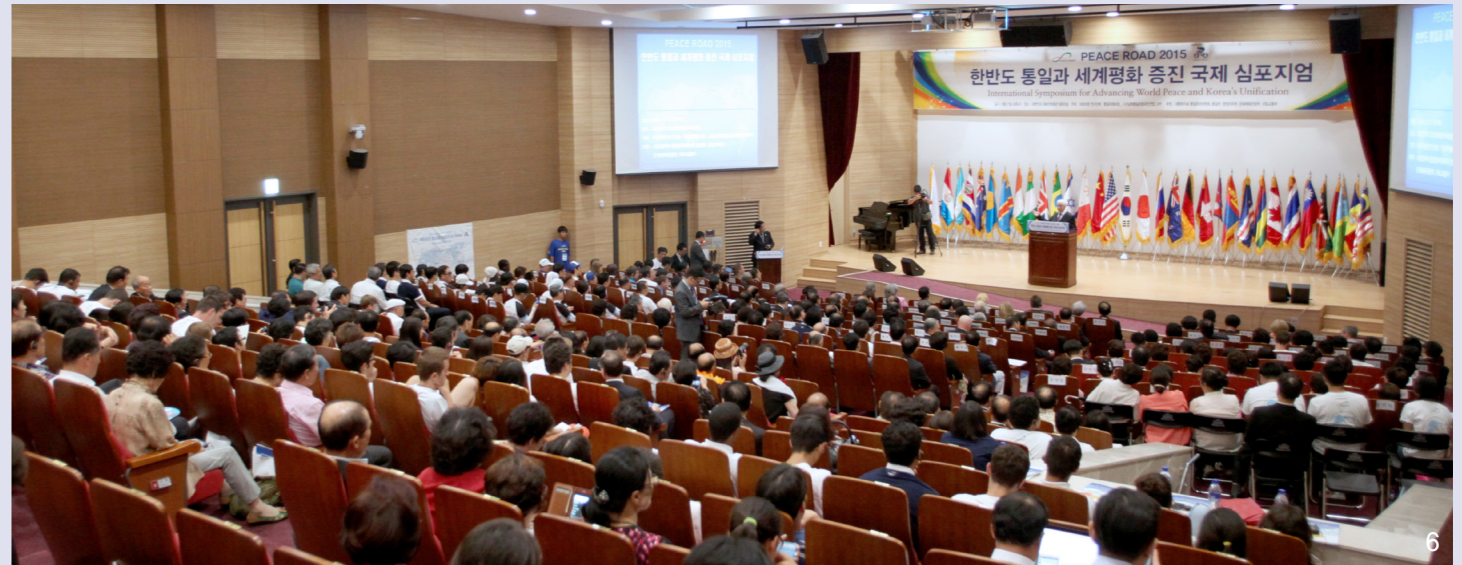
1. 歓迎の辞を述べる孫炳浩ピースロード韓国実行委員長 2. 祝辞を述べるレオニード・クラフチュクウクライナ初代大統領 3. 歓迎の辞を述べるチョ・ミョン Chol国会議員