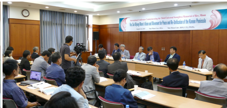
第3分科討論の全景