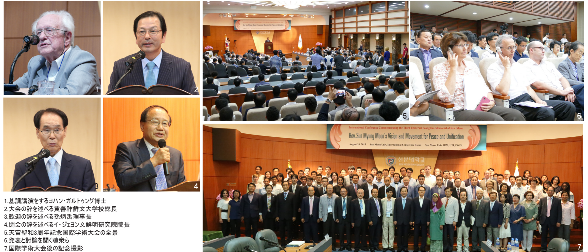
1.基調講演をするヨハン・ガルトゥング博士 2.大会の辞を述べる黄善祚鮮文大学校総長 3.歓迎の辞を述べる孫炳禹理事長 4.閉会の辞を述べるイ・ジョン文鮮明研究院院長 5.天宙聖和3周年記念国際学術大会の全景 6.発表と討論を聞く聴衆ら 7.国際学術大会後の記念撮影

この日の国際学術大会では、学術思想、宗教平和、韓半島平和、世界平和、社会運動、未来平和、家庭平和、文化芸術、平和学など9つの分科に分かれて学者らの熱い発表と討論が行われた。特に最近、南北間の軍事的