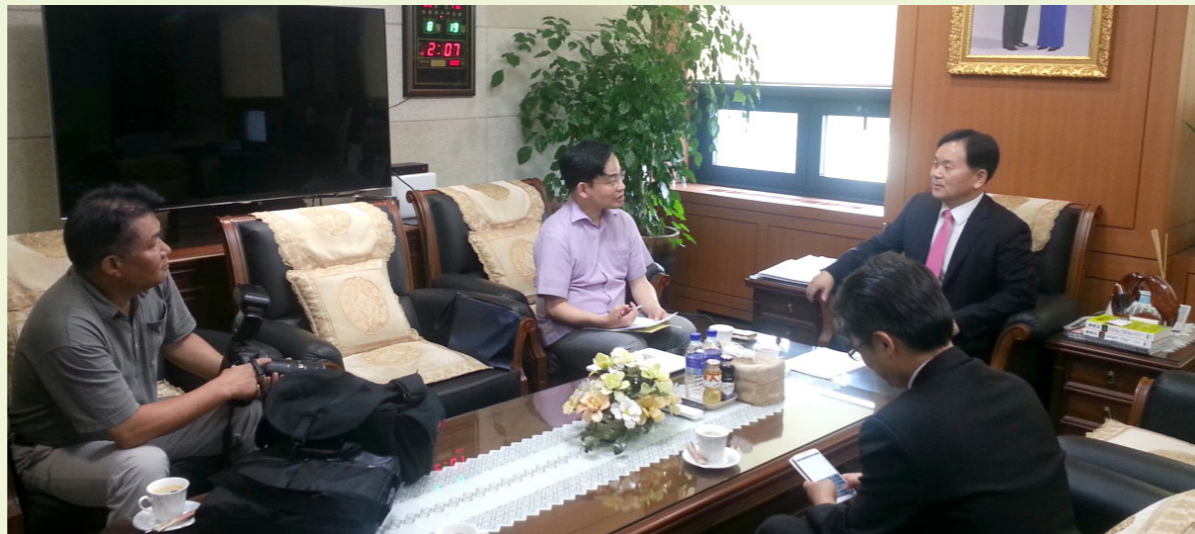
ニューシス記者とのインタビュー