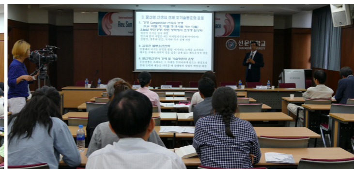
第6分科討論の全景