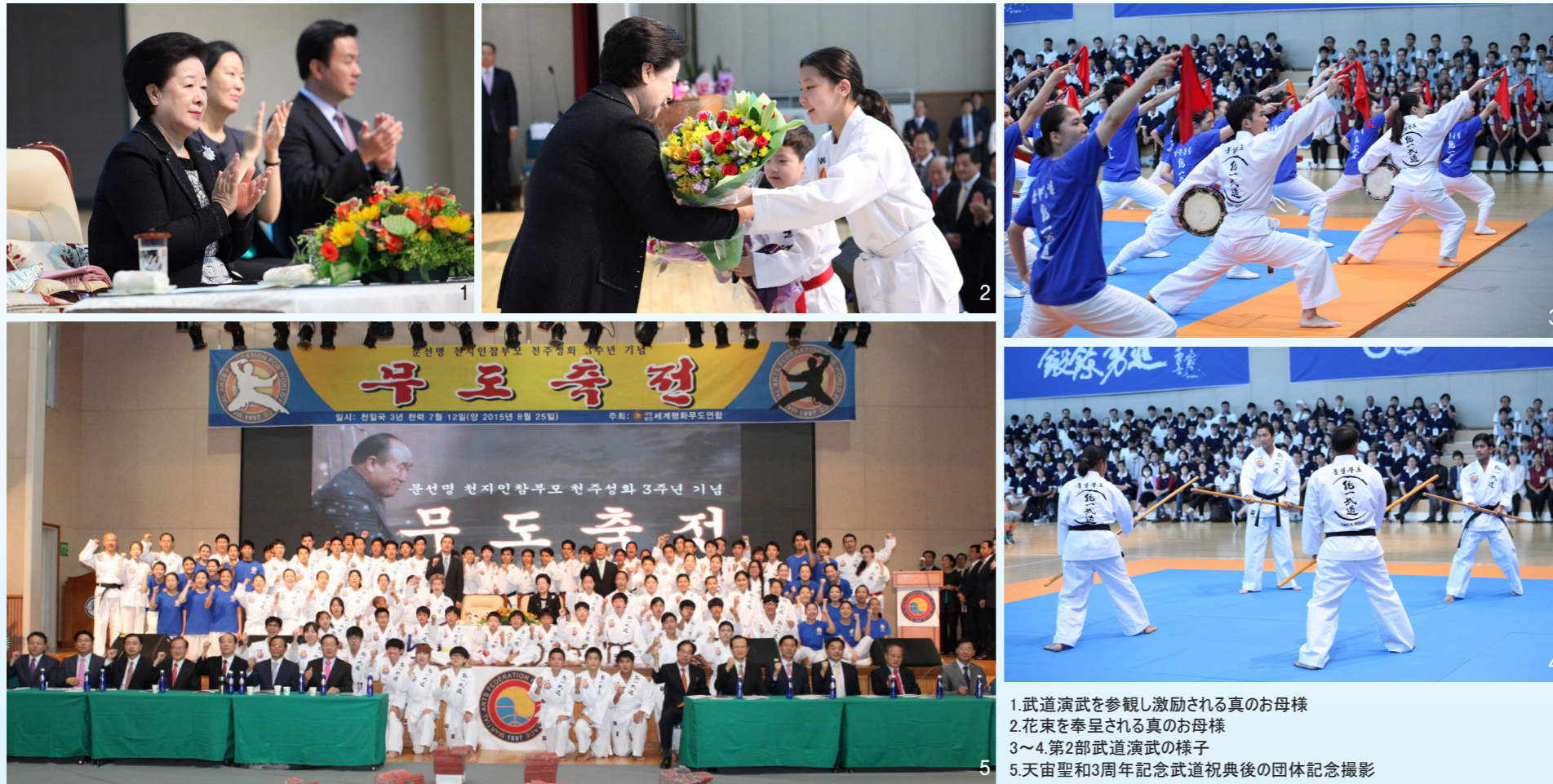
1. 武道演武を参観し激励される真のお母様 2. 花束を奉呈される真のお母様 3~4. 第2部武道演武の様子 5. 天宙聖和3周年記念武道祝典後の団体記念撮影

(社)世界平和武道連合(以下、武道連合)主催・文鮮明天地人真の父母天宙聖和3周年記念武道祝典が、天曆7月12日(陽曆8.25)午前10時30分、真の父母様を中心に清心国際青少年修練苑体育館で開催された。