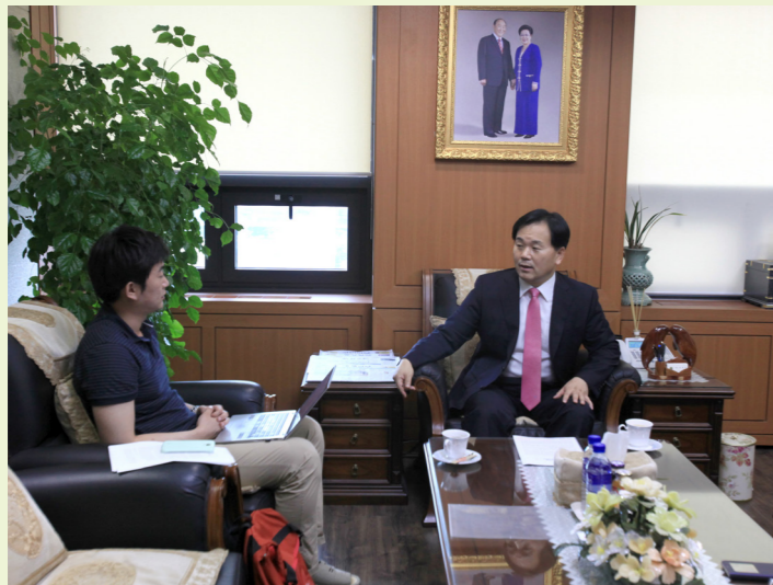
文化日報記者とのインタビュー