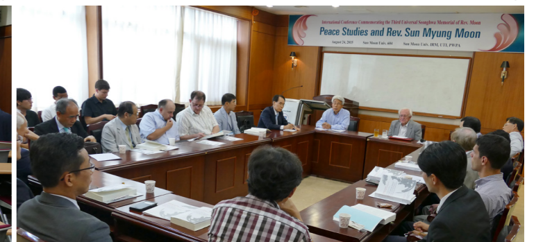
第9分科発表者と討論者ら