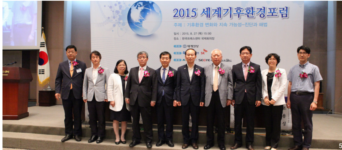
1.開会の辞を述べるチャ・ジュンヨン世界日報社長 2.基調講演を述べるヤン・スギル前緑色成長委員会委員長 3.祝辞を述べるユン・ソンギョ環境部長官