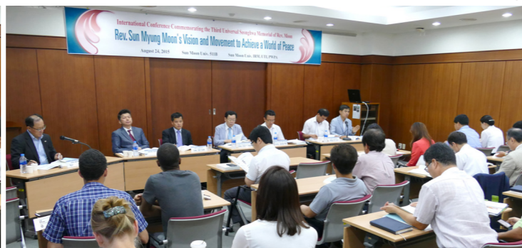
第4分科討論の全景