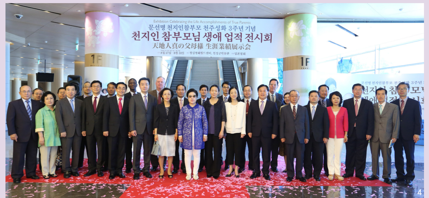
1.生涯業績展示会(清心平和ワールドセンター)を観覧される真の父母様 2~3.天正宮博物館展示室を観覧される真の父母様